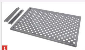
1 Plateau avec supports