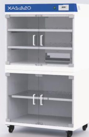
2 Meuble rehausseur

Surélève l'armoire pour un meilleur confort de chargement. Roulettes pivotantes avec freins. Etagère en supplément.